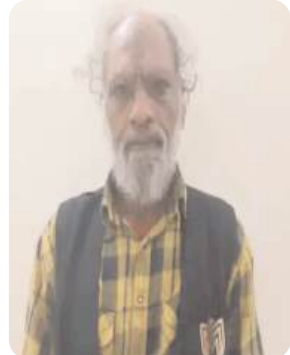
लैब भेज दिया गया है।